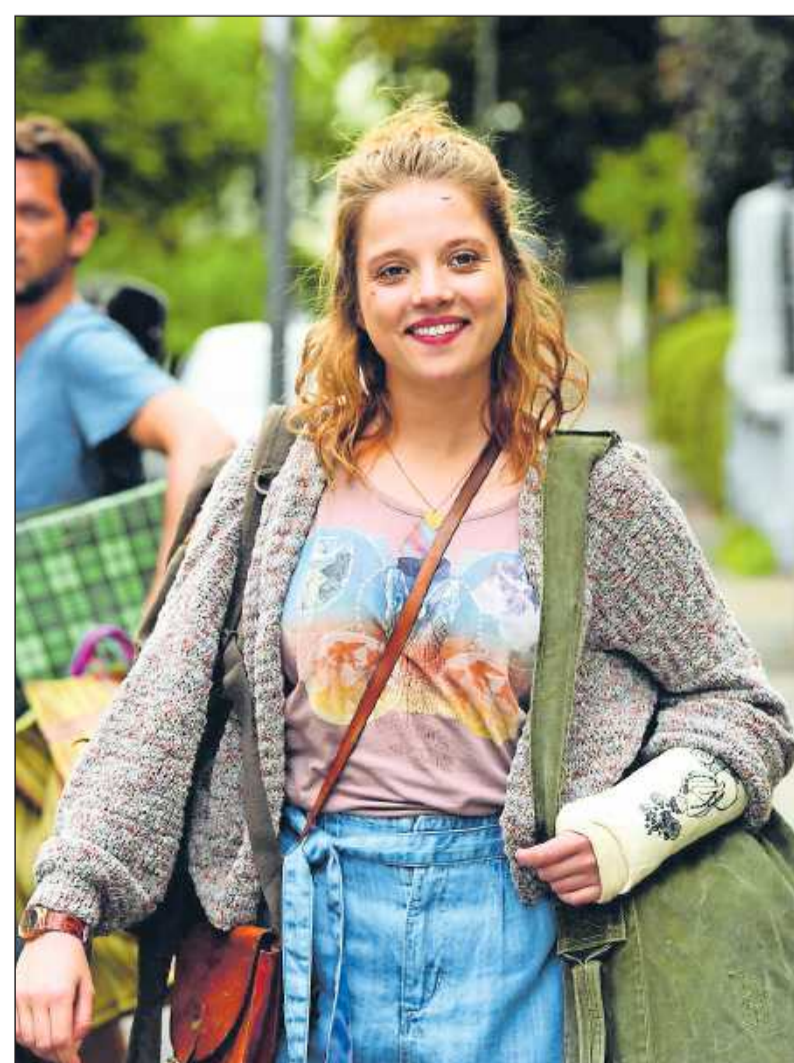
Von der Ulknudel zur Aussteigerin: Jella Haase in „Vielmachglas“.