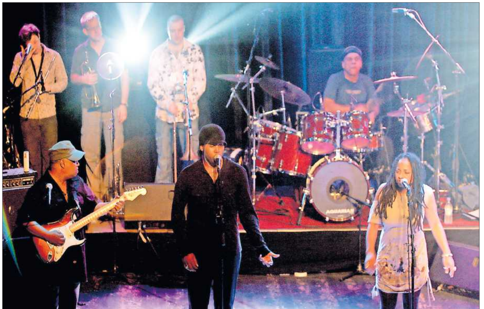
Incognito vor einigen Jahren in Kaiserslautern: Die Band um Sänger Jean-Paul „Bluey“ Maunick (Mitte) kommt im Sommer nach Dürkheim auf die Limburg.