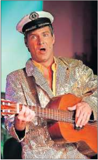
Comedian Markus Kapp.