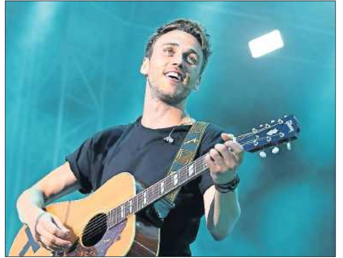
Kommt für einen „Neuanfang“ nach Ludwigshafen: Clueso.