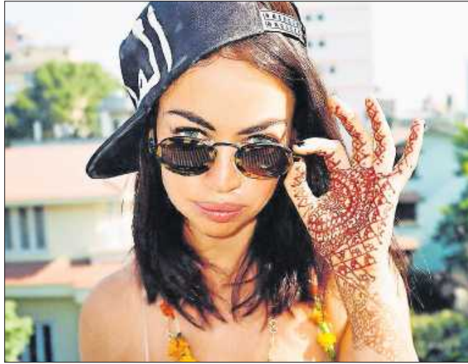
Ohne Nachname, dafür mit Hits im Gepäck: Aura.